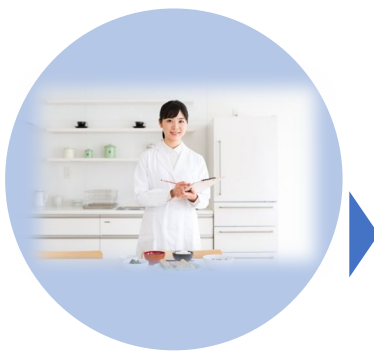
オンライン初回面談 日常生活をアドバイス