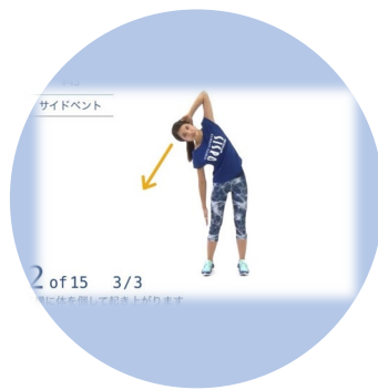
1日5分の継続 トレーニング