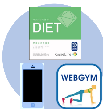
簡単! 遺伝子検査の実施 WEBGYMアプリのダウンロード