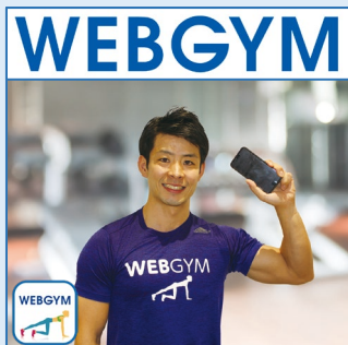
トレーニングアプリ