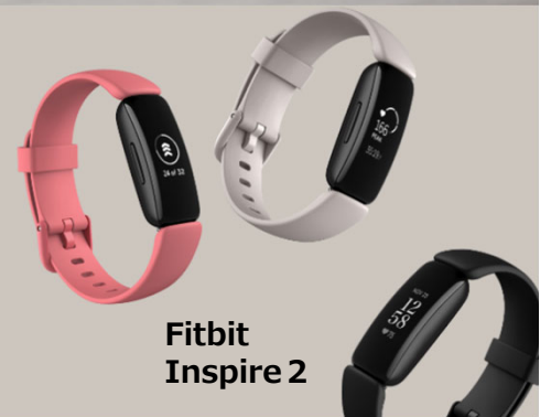
Fitbit Inspire 2

※カラーを3色からお選びいただけます ・ブラック ・ルナホワイト ・ローズピンク