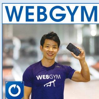
トレーニングアプリ