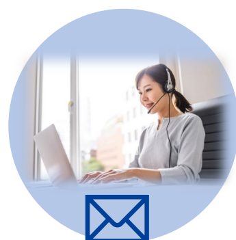
(積極的)オンライン評価面談 (動機付)メールにて振り返り