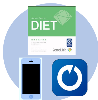
簡単！遺伝子検査の実施 WEBGYMアプリのダウンロード