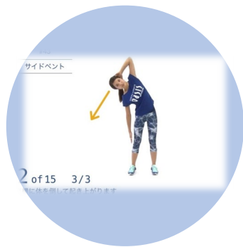
1日5分の継続 トレーニング