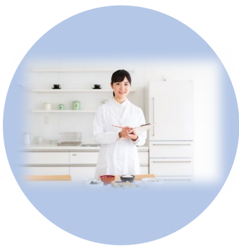
オンライン初回面談 日常生活をアドバイス