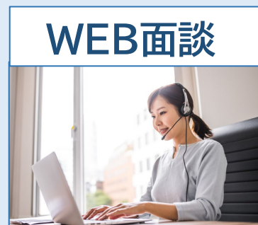
オンライン面談 (WEBGYMアプリから)